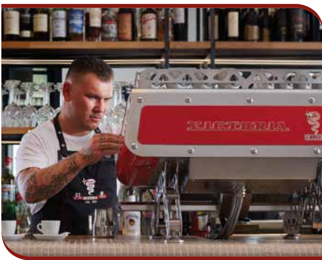
Your personal style

Le nouveau système de contrôle de température d'extraction du café par thermostat PID, permet une programmation précise de la température du café. Grâce à la stabilité du circuit hydraulique, l'exaltation des arômes de chaque type de café est garantie.